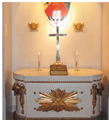
S:t Johanneslogen Elisabeth i Kanton

När han senare i livet donerade textilier till Tensta kyrka med sol- och korsmotiv, var det kanske inte bara kristna symboler han såg, utan även tecken som påminde honom om de edsvurna bröderna vid Pärflodens strand.