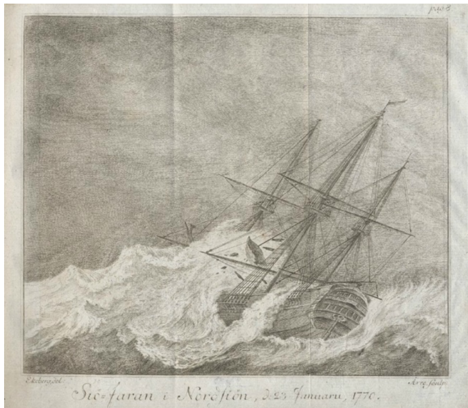
Skeppet Finland, teckning CG Ekeberg

Efter nio månaders kamp mot naturens krafter har målet nåtts. I juni 1771 vänder Finland åter mot Sverige, tungt lastad med det te, siden och porslin som ska förgylla de svenska hemmen och säkra Kompaniets vinst.