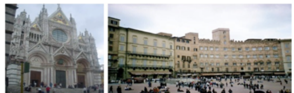
Duomo i Siena