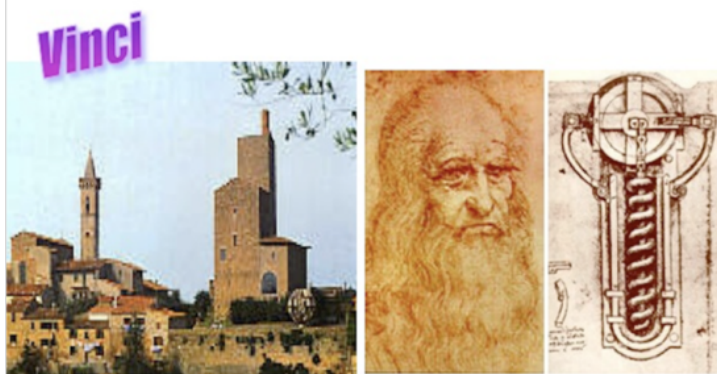
Besök på Leonardo da Vincis museum