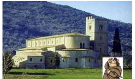
Sant Antimo kloster