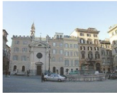
S. Brigida kyrka