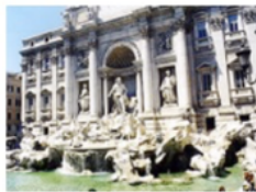
Fontana de' Trevi