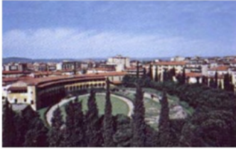
Sista lunchen med gänget i Arezzo - före avfärd till Rom