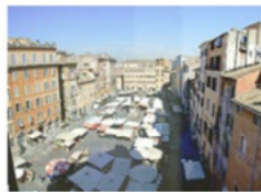
P. Campo de' Fiori - en pizza sista kvällen