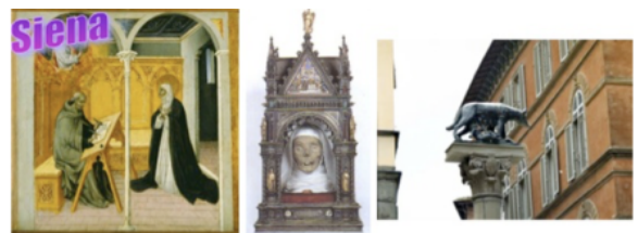
Här vilar S. Chaterina's huvud