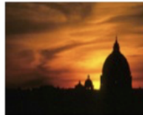
Rom by night