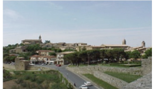
Montalcino - Brunellovinet!