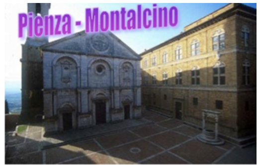
Födelseort för påven Pius II