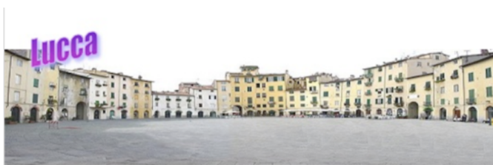
torget är själva staden - en inbyggd romersk arena

På kvällen smiter vi från gruppen och äter fantastisk middag på La Taverna di San Giuseppe. Till vår förskräckelse upptäcker vi att våra Eurocard blivit kvar på hotellet, men med lite tur skramlar vi ihop tillräckligt många Euro ... men när notan kommer inser vi att vi har ingen anledning att oroa oss!